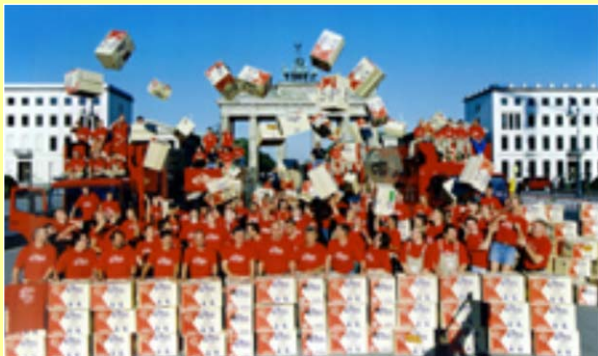
confern Mitarbeiter vor dem Brandenburger Tor – nach dem Umzug des Deutschen Bundestages von Bonn nach Berlin im Jahre 1999.